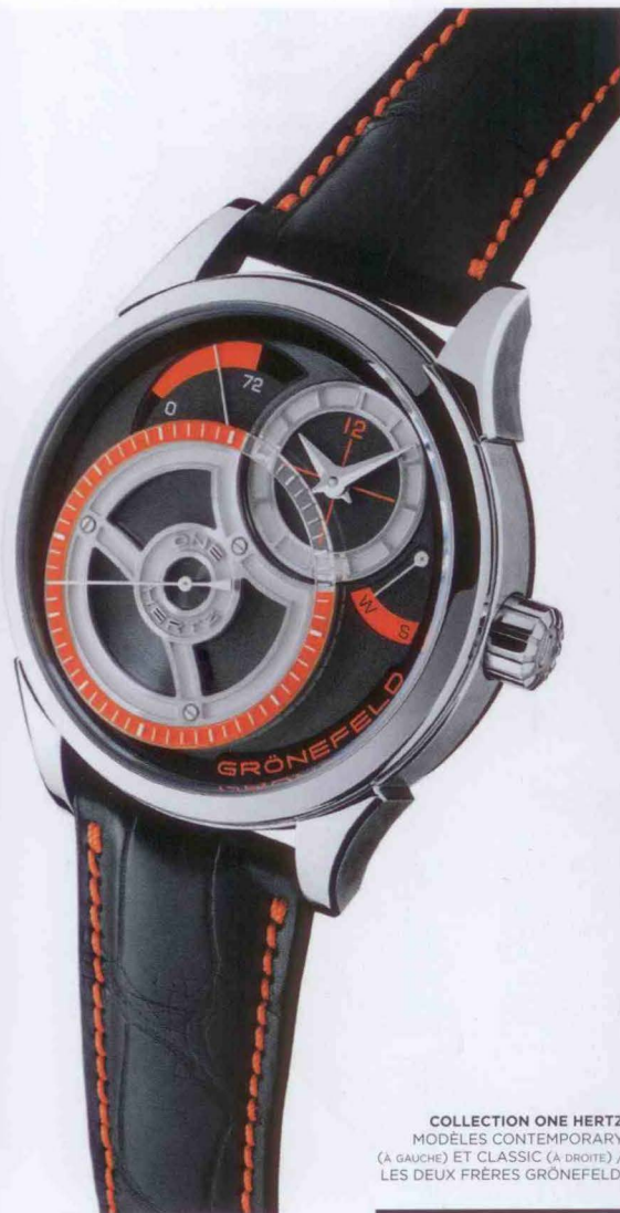
COLLECTION ONE HERTZ MODÈLES CONTEMPORARY (À GAUCHE) ET CLASSIC (À DROITE) / LES DEUX FRÈRES GRÖNEFELD.