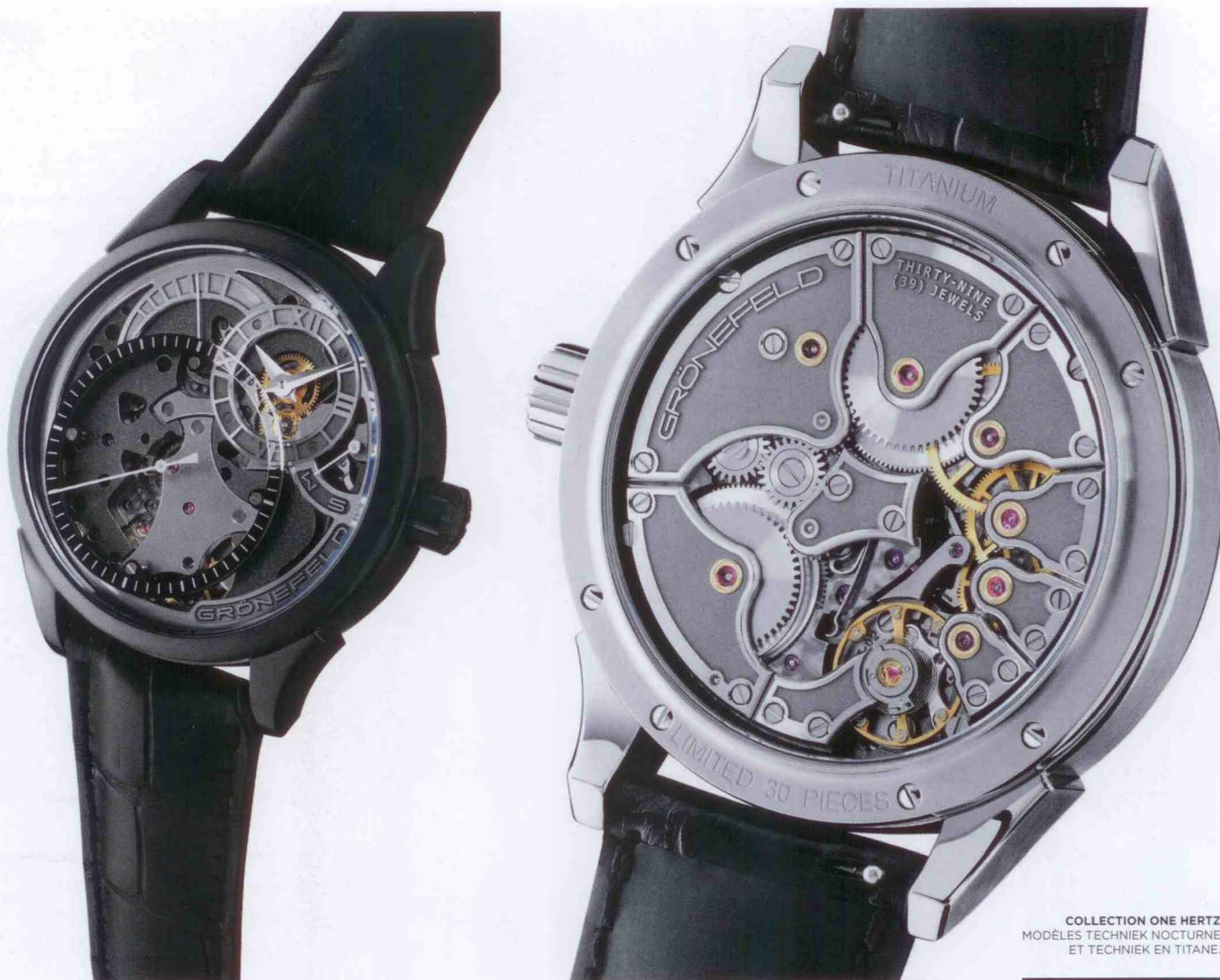
COLLECTION ONE HERTZ MODÈLES TECHNIK NOCTURNE ET TECHNIK EN TITANE.

pièce inaugurale leur vaut les honneurs de la télévision néerlandaise mais son prix élevé surprend les non-initiés : "255 000 euros pour les pièces en or, 275 000 pour celles en platine", se souvient Tim. Ces tarifs n'empêchent pourtant pas des collectionneurs américains, asiatiques et même un Néerlandais, d'acquérir les premières montres Grönefeld.