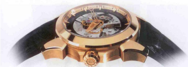
LES FRÈRES GRÖNEFELD / MONTRE GMT-06 EN OR ROSE / CAGE DU TOURBILLON GMT-06 / BART GRÖNEFELD MOUVEMENT N°1 RÉPÉTITION MINUTES.