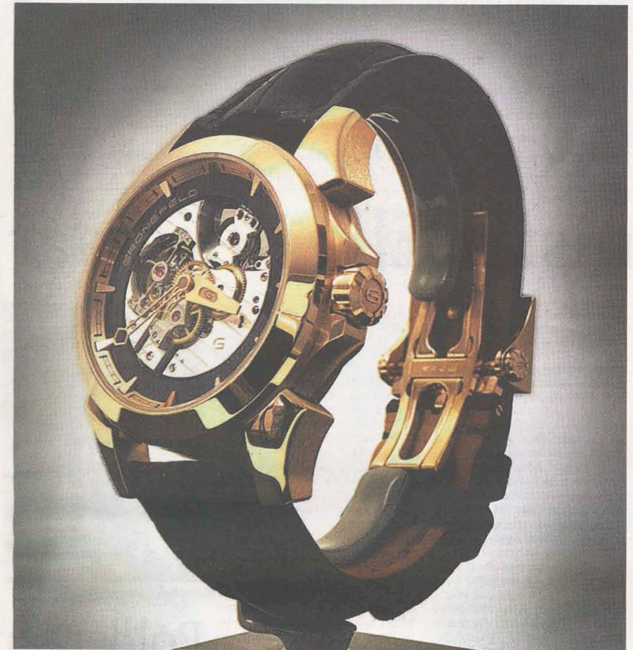
De geboorte van de eerste Grönefeld is een feit. Bijzonder aan het horloge is onder meer de transparantie: de techniek in de kast is zichtbaar door een venster aan voor- en achterkant.

pareerden hier tot voor kort de horloges van de grotere merken. Steeds in nauw contact met de Zwitserse opdrachtgevers en leveranciers. Eerwol werk. Dat zeker, maar Bart en Tim wilden meer, met als resultaat dat de eerste Grönefeld morgen in hun nieuwe showroom aan de Steenstraat het levenslicht ziet.